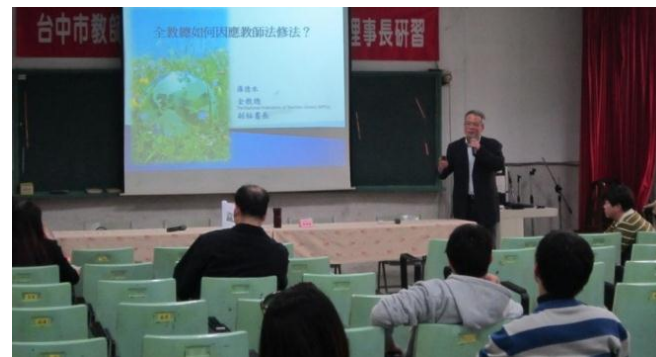
國中小理事長研習會議