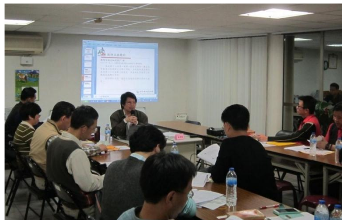
高中職理事長研習會議