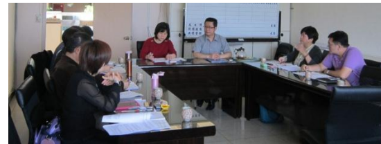
103/3/26 交通導護協商諮詢會議